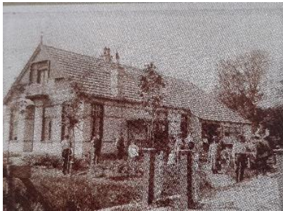
Woning Tjipke Werkman 1910

De naam "Clantlaan" verwijst naar de adellijke familie Clant, die via huwelijk aan de familie Asschendorp is verbonden. Asschendorp was het laatste adellijke geslacht dat op de borg woonde.