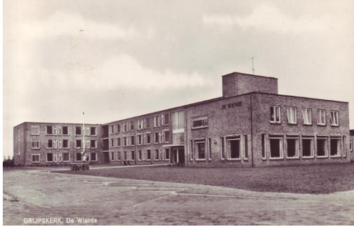
Het bejaardenhuis De Wierde in 1963

Lang voordat de borgheren zich hier vestigden, was er rond het begin van de jaartelling al sprake van bewoning. Dat kwam aan het licht bij de bouw van het bejaardenhuis in 1963. Bij graafwerkzaamheden zijn sporen van prehistorische bewoning aangetroffen.